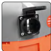
Gniazdo zewnętrzne 3200 W