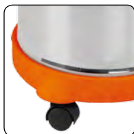
Podstawa na kołach