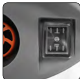
Dwa tryby pracy