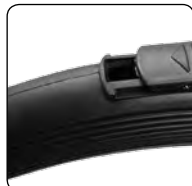
Regulacja przepływu powietrza